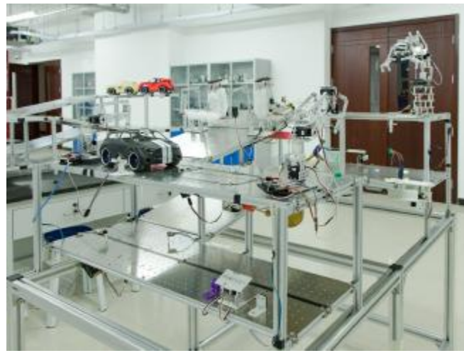
地面机动装备实验教学中心