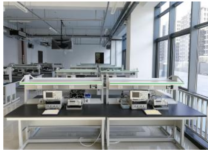
电工电子教学实验中心