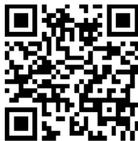
更多精彩内容,可扫码浏览