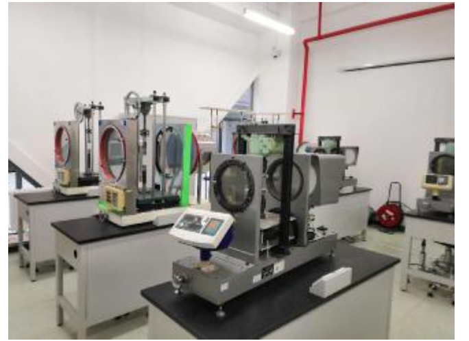
基础力学教学实验中心