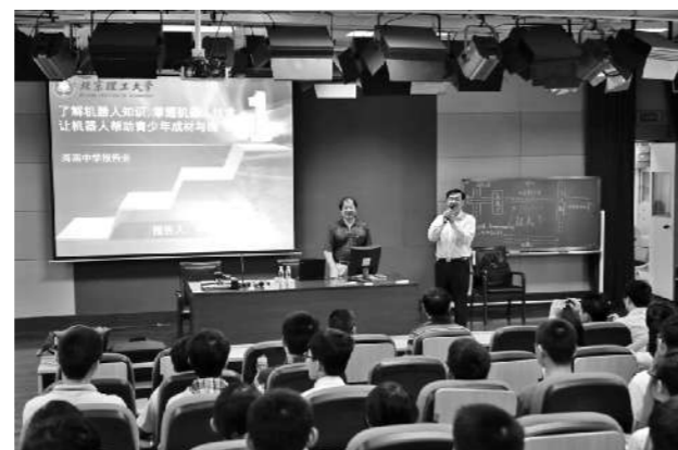
2015年8月罗老师带领团队前往海南中学开展科技创新夏令营

罗庆生,1956年出生,教授,博士生导师,北京理工大学机械电子工程专业责任教授,北京教学名师;总装备部、工信部、科技部、教育部、中国创新基金评审委员会、中国军民两用技术评审委员会、国务院学位评审委员会特聘专家;中国高校创新学会副理事长;创新教育委员会主任;北京航空航天大学、浙江大学、华中科技大学、西北工业大学、中南大学等8所高校学报编委。主要从事机电一体化技术、特种机器人技术、工业机器人技术、机电伺服控制技术研究。获国家发明专利25项;国家级优秀教学成果二等奖一项;省部级优秀教学成果一等奖5项;省部级科技进步一、二等奖各2项;校级优秀教学成果一等奖5项;校级课堂教学效果最佳奖2项;校“我爱我师”最佳教师称号2次;“感动北理,激励你我”最佳人物1次;校“师德标兵”1次;校“先进党员”称号1次。主持省部级以上科研项目25项,总经费逾千万元;出版学术专著11部;2015年3月,所著“智能作战机器人”获中国出版业最高奖——中华优秀图书奖;发表论文200余篇,EI收录60余篇。