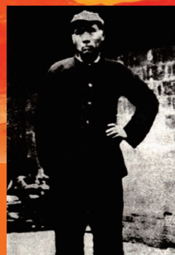
徐特立同志在延安(1937年)

【编者按】徐特立同志是我国杰出的无产阶级革命家、教育家,是我校延安创校时期自然科学学院的主要创建者,徐特立教育思想已成为我校宝贵的精神文化财富,时至今日仍有十分重要的现实意义。为了更好地弘扬徐特立老院长崇高的精神和教育思想,本报将连载《我们的老院长徐特立》一书,以供广大师生员工学习研究。